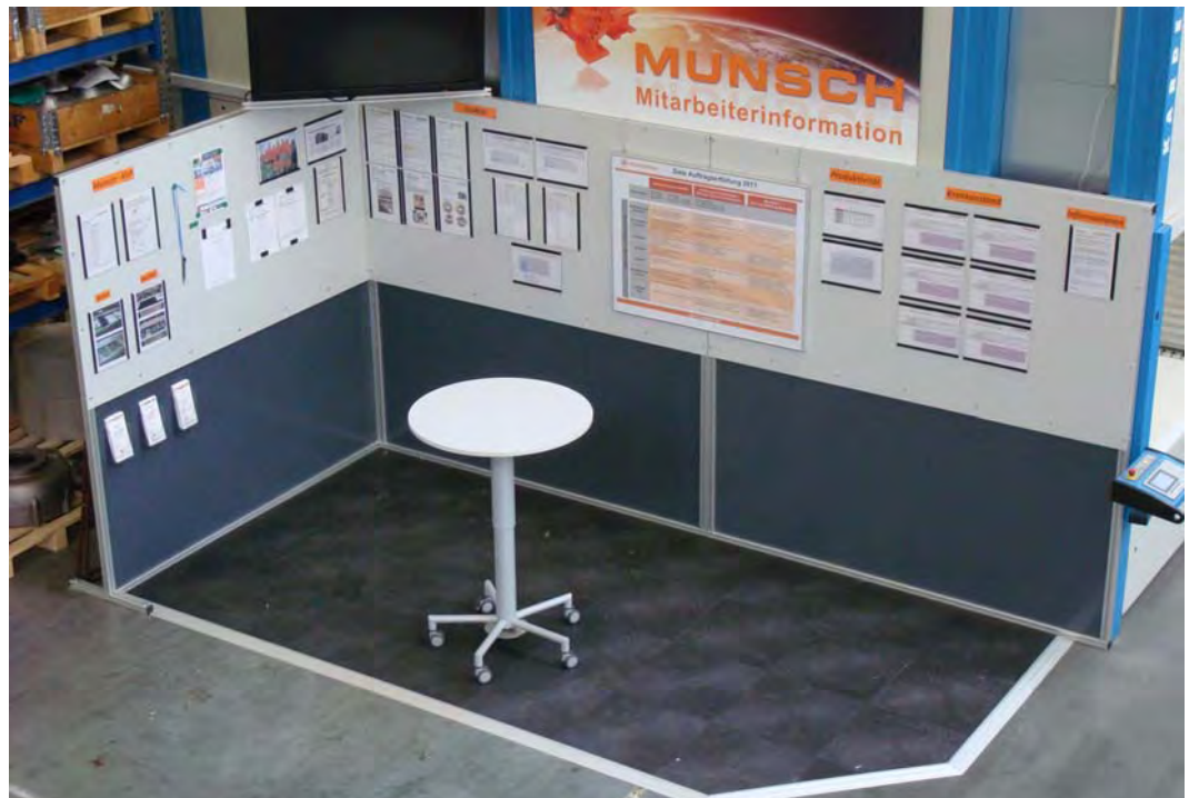
Abb. 4: Meeting Point der Firma Munsch Chemiepumpen GmbH