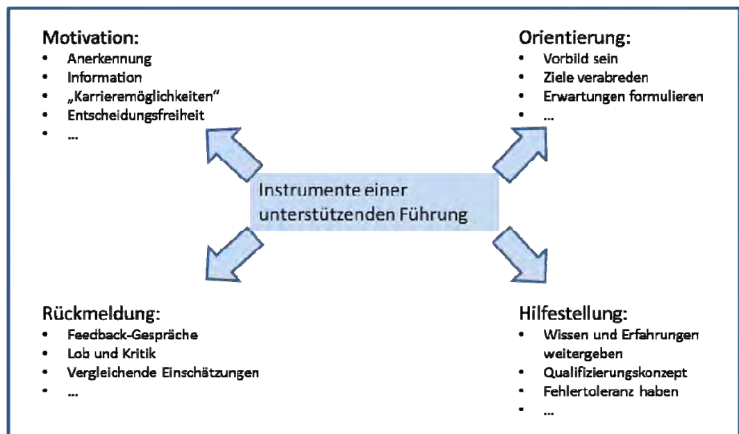
Abb. 3: Unterstützende Führung bedeutet in vielen Fällen einen deutlichen Wechsel in der Führungsphilosophie

Bei alledem ist sie aber vor allem auch eins: Sie ist die Führungskraft, die sich aufgrund ihrer Handlungen, ihrer Vorgehensweise und ihrer Persönlichkeit den absoluten Respekt ihrer Mitarbeiter verschafft hat. Sie zeigt den Mitarbeitern Grenzen auf, die oft lange Jahre nicht betrachtet worden sind. Sie spricht mit Mitarbeitern, die nicht mitziehen wollen oder nicht mitziehen können. Sie klärt die Gründe und hilft, wo es möglich ist. Sie spricht aber auch Ermahnungen und Abmahnungen aus, wenn das Verhalten von Mitarbeitern dies erforderlich macht. Die unterstützende Führungskraft ist nicht plötzlich der beste Freund der Mitarbeiter, sondern sie ist ein Chef mit klaren Vorstellungen, der durch seine Unterstützung dem System als Ganzem den größten Dienst erweist.